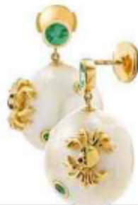
Or jaune, perles, tsavorites et diamants noirs. Yvonne Léon, 3250 €.