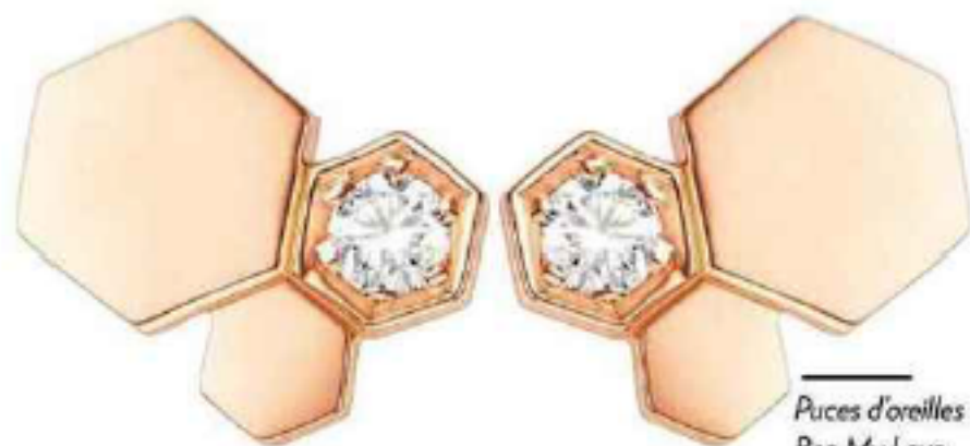
Puces d'oreilles Bee My Love, or rose et diamants, Chaumet, 2100 €.

«les boucles apportent un côté glamour à une tenue, même la plus simple, et font un port de princesse une fois les cheveux relevés.» A condition de faire attention à certains paramètres, comme la force de pression du clip et le poids du bijou.