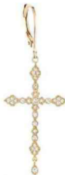
Apkallu Constellation, vermeil, Persta, 600 €.