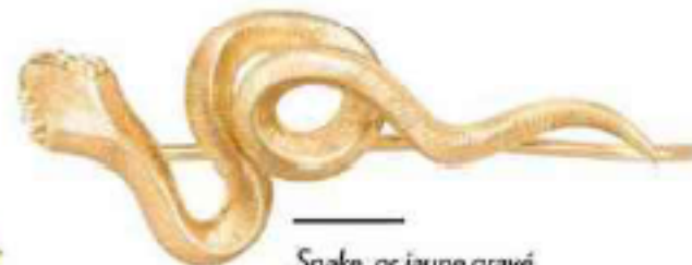
Snake, or jaune gravé, Ole Lynggaard Copenhagen, 300 €.