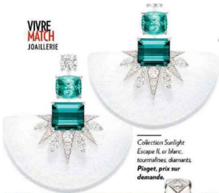
Collection Sunlight Escape II, or blanc, tourmalines, diamants. Piaget, prix sur demande.

Or blanc et diamants de synthèse. Burma, 1500 €.