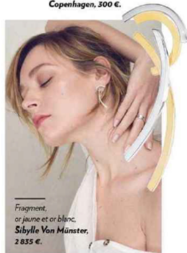
Fragment, or jaune et or blanc, Sibylle Von Münster, 2835 €.