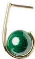
Beluga, or jaune et malachite. Marc Deloche, 550 €.

Bulgari Bulgari, or rose, sugillite, malachite et nacre. Bulgari, 1900 €.